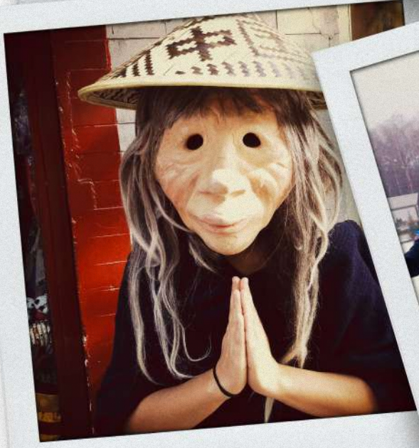
Hong Kong 2018