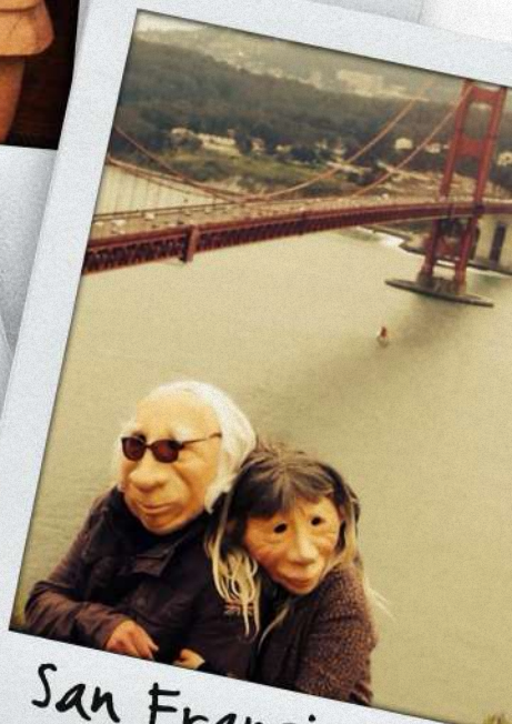
San Francisco 2022